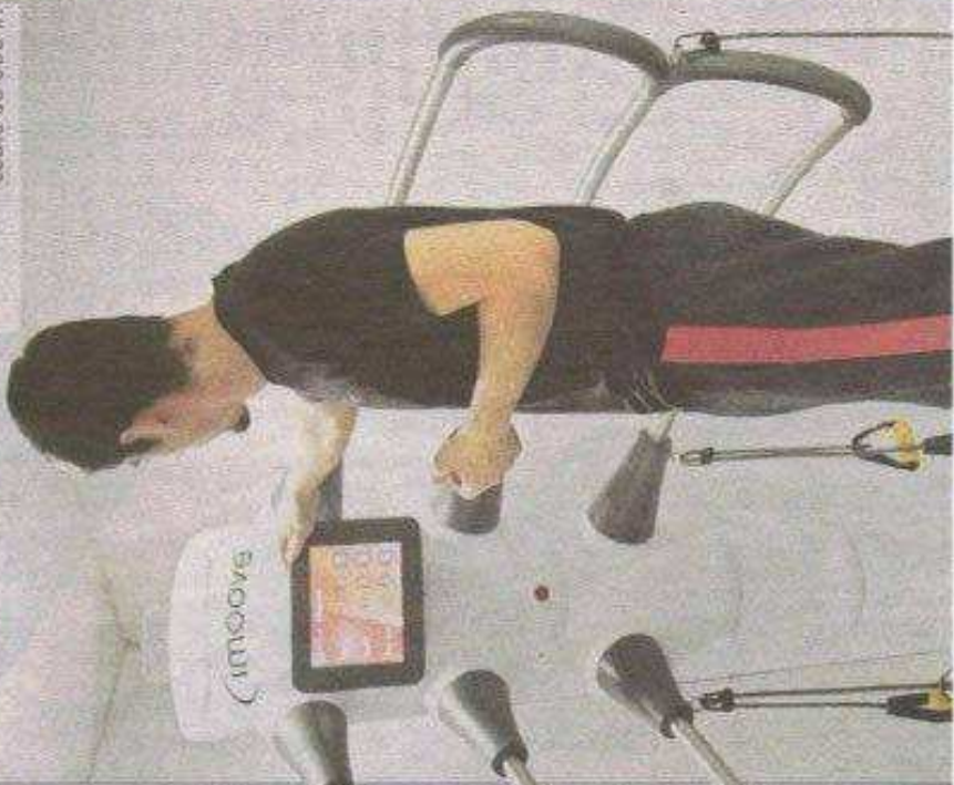
Pas de vibrations, mais une plateforme qui bouge sur une dem-